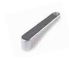
INK Clè à levier pour débrayage INTRO LOCK (cond. 4 pces)