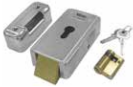
LOCK HO Serrure électrique 12 V horizontale