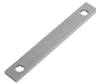
INTRO FR Adaptateur pour caisson de fondation