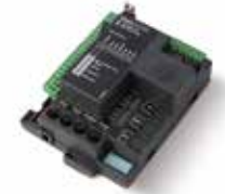
STARG8 24 Centrale de recharge 24 Vcc