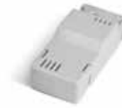
BAT K3 Carte de charge des batteries BAT M 016