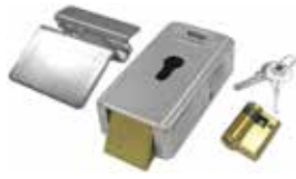
LOCK VE Serrure électrique 12 V verticale