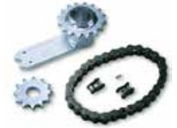
INT 360 Kit pour ouverture vantail à 360°